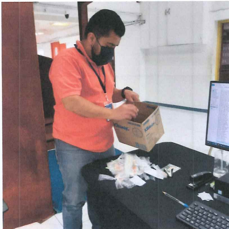
TRASLADO DE DOCUMENTOS