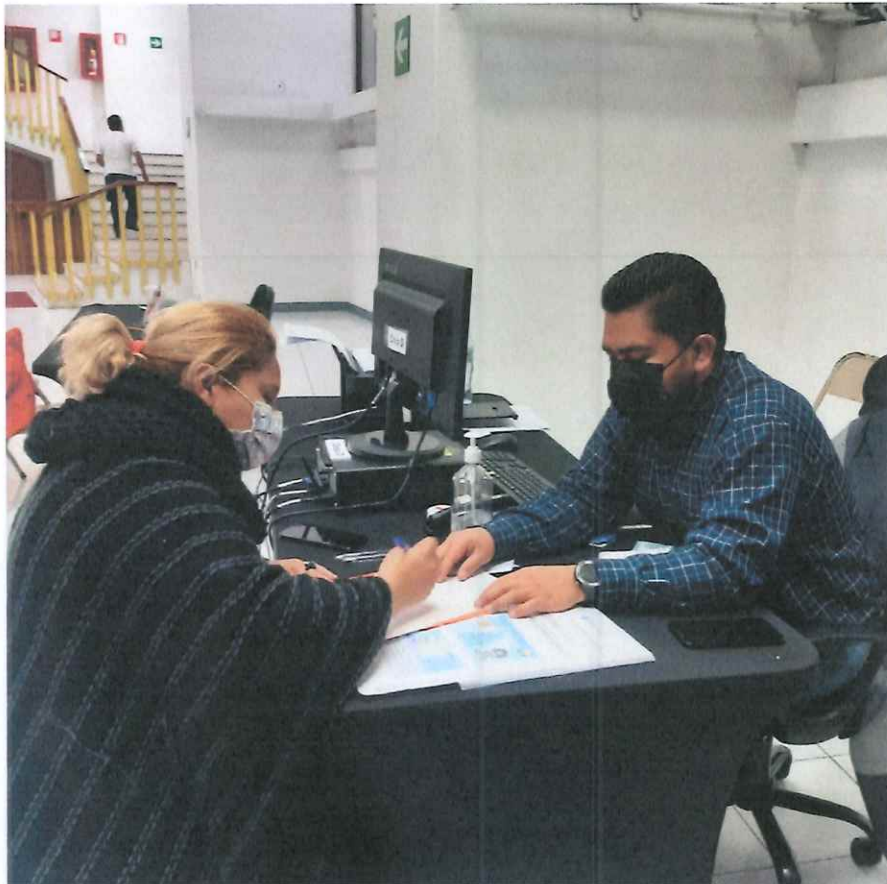
Recepción de expedientes

Se apoyó en la recepción de los documentos de soporte, que los artistas presentaron para recibir el apoyo económico de Apoyarte 2021, en las instalaciones del Teatro Nacional de Guatemala Miguel Ángel Asturias, y se verificó que la papelería estuviera completa según los requisitos del Acuerdo Ministerial No. 1078.