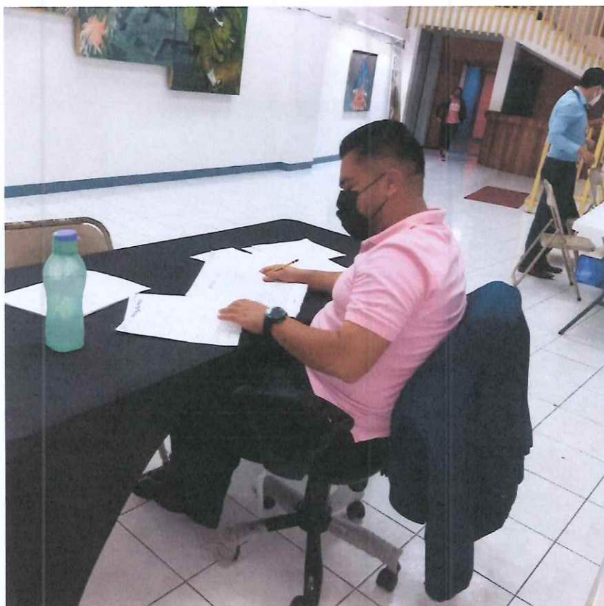
CLASIFICACIÓN DE EXPEDIENTES

Se inició el proceso de ordenamiento y clasificación de la documentación de soporte para conformar el expediente de cada artista, apoyando a cada persona en realizar fotocopias del Documento Personal de Identificación -DPI-.