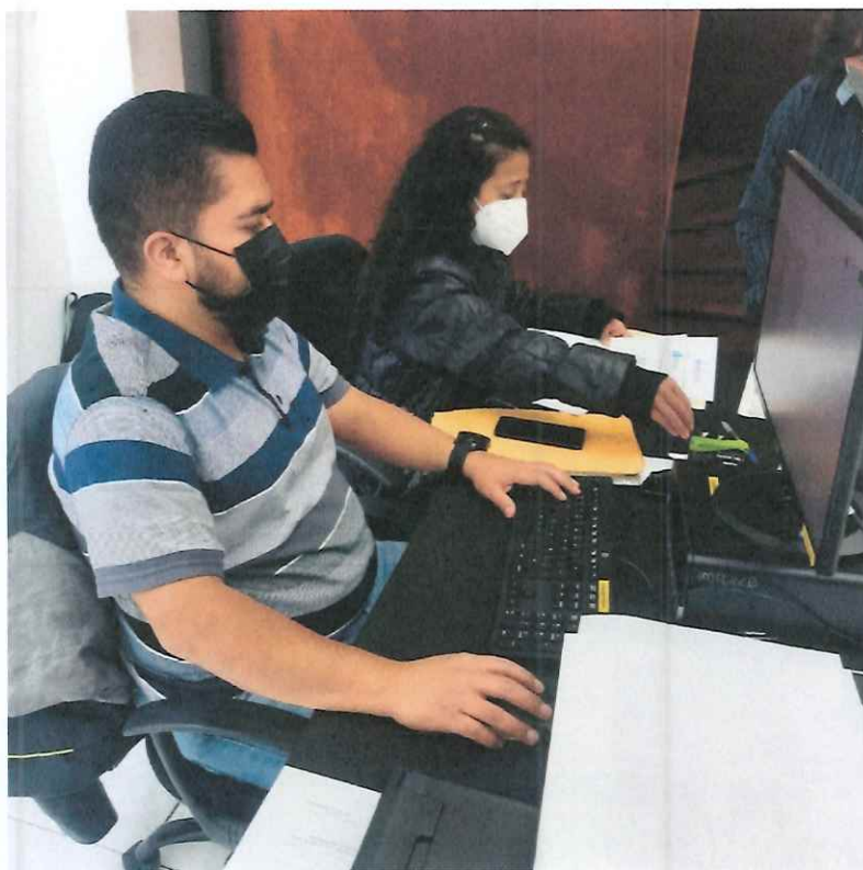
REVISION DE DOCUMENTOS

Se apoyó al Departamento de Apoyo a la Creación Artística, en la clasificación y análisis de los documentos que fueron entregados por los artistas.